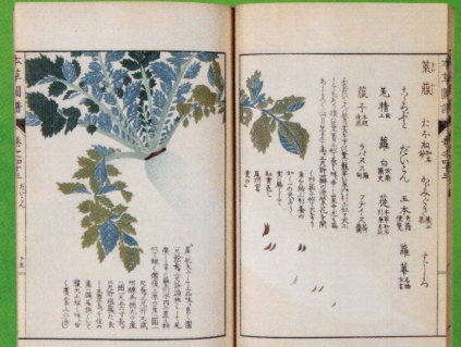
左:昭和八年秋期 三陽種苗商報第三十三号(表紙原画) 館蔵 右:本草図譜(菜部巻之四十三) 館蔵