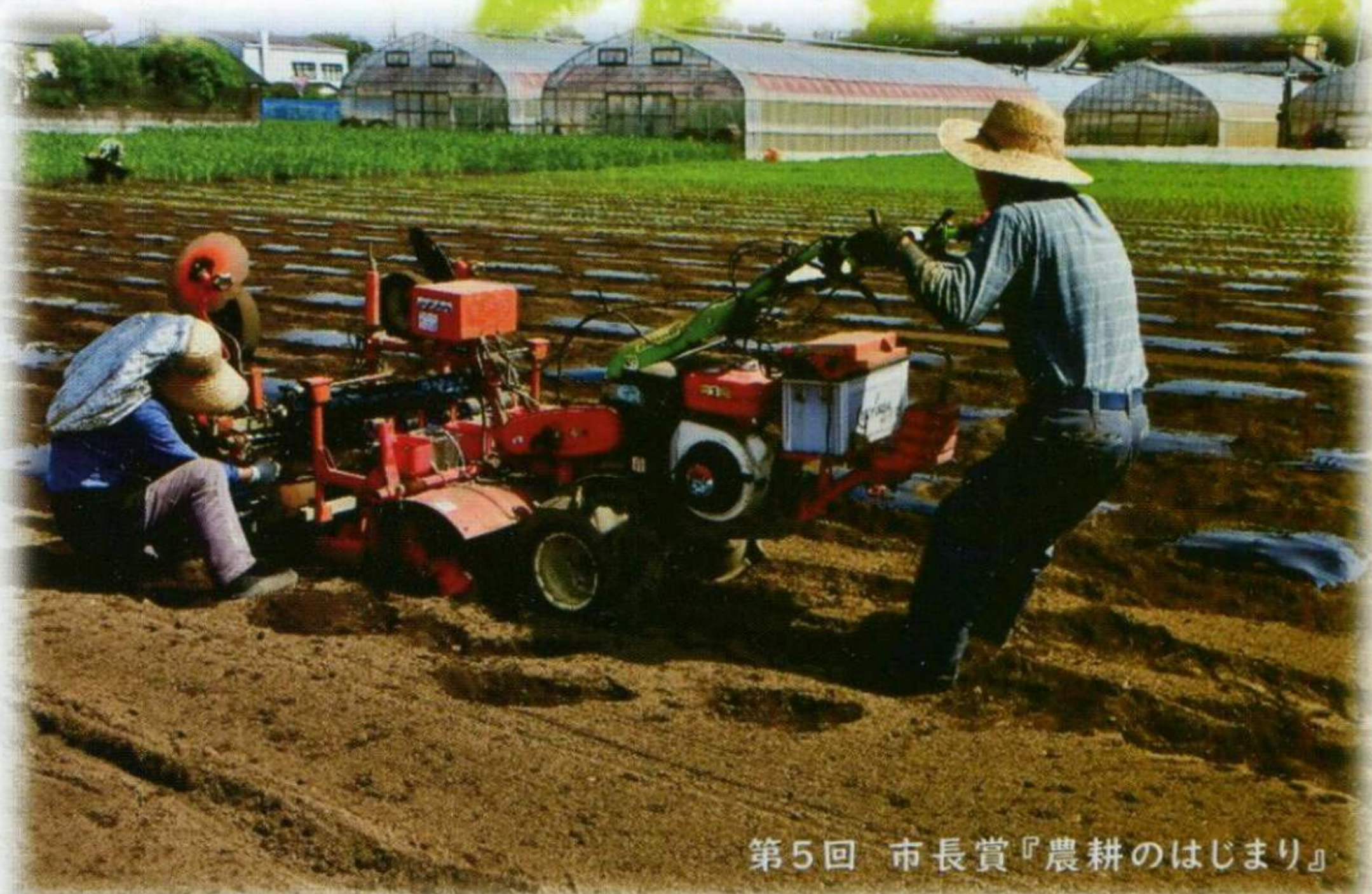
第5回 市長賞『農耕のはじまり』