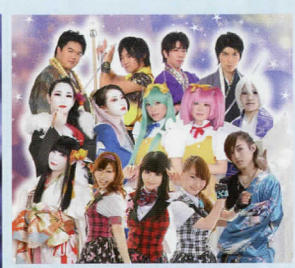
どりいむぼふおーまんす♪きやらくたーず