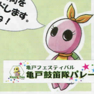
亀戸フェスティバル 亀戸鼓笛隊パレード