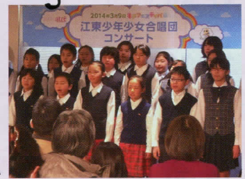
昨年のコンサートの模様