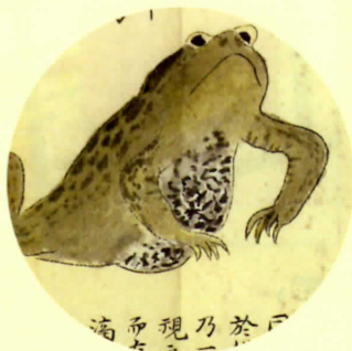
谷中の岩崎灌園の庭のヒキガエル 『弘賢随筆』巻35、国立公文書館蔵