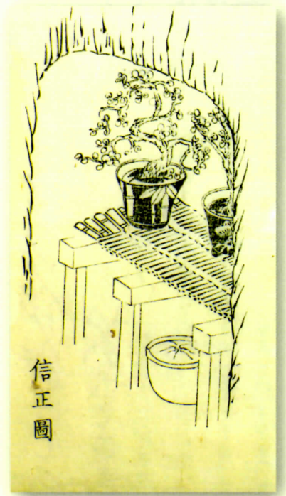
灌園の息子・信正による穴むろの図 （『草木育種後編』下巻、部分、個人蔵）

また本年4月の中央図書館谷中分室のオープンを記念して、灌園が住んでいた自然豊かな「谷中」の姿を掘り起こします。地域に密着した「谷中ショウガ」や「舟つなぎ松」、さらには彼の庭のカエルや温室で栽培した鉢植など、動植物と人間の身近なかかわりを明らかにします。