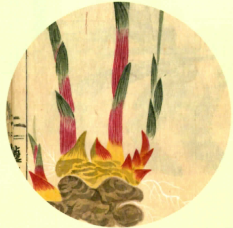
『本草図譜』巻47「薑(きょう。ショウガのこと)」 千住や根岸にて作ると書かれている