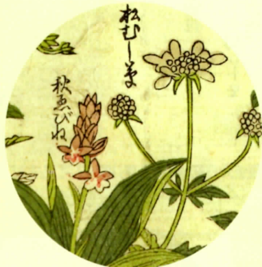
茶花の図譜『茶席挿花集』個人蔵