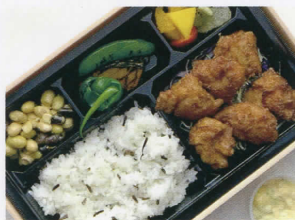
鶏の唐揚げ“ざんぎ” BENTÔ 福井“いちほまれ”とワイルドライス 3,000円 (税込)

〔アレルギー表示指定原材料〕乳成分、卵、大豆、りん ご、キウイフルーツ、オレンジ