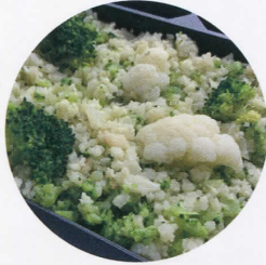
カリフラワー＆ブロッコリー ライス

福井県が誇る新しいお米にスーパー フードで今注目のワイルドライスを 合わせました！