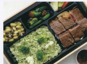
和牛ステーキ BENTÔ カリフラワー＆ブロッコリーライス 4,000円 (税込)

〔アレルギー表示指定原材料〕小麦、卵、牛肉、豚肉、大 豆、キウイフルーツ、オレンジ