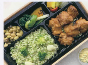
鶏の唐揚げ“ざんぎ” BENTÔ カリフラワー＆ブロッコリーライス 3,000円 (税込)

信玄どりもも肉を醤油、にんにく、生姜で漬け込 む北海道郷土料理“ざんぎ”に仕上げました。タ ルタルソースと一緒にどうぞ。