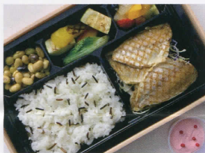
天然小鯛のグリエ BENTÔ 福井“いちほまれ”とワイルドライス 3,000円 (税込)

〔アレルギー表示指定原材料〕小麦、卵、牛肉、豚肉、大 豆、キウイフルーツ、オレンジ