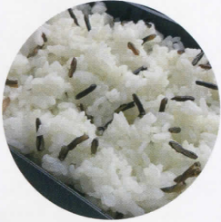
福井“いちほまれ”とワイルド ライスの特製ライス

福井県が誇る新しいお米にスーパー フードで今注目のワイルドライスを 合わせました！