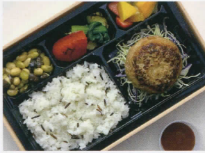
江戸前ハンバーグ BENTÔ 福井“いちほまれ”とワイルドライス 3,000円 (税込)

マンスールとは、美味しく食べてヘルシーであるという意味です！ NYセレブに大流行したカリフラワーライスでお召上がりください。