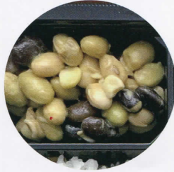
希少・埼玉在来大豆の発芽 大豆のマリネ

NYセレブに大流行したカリフラワー ライス！糖質が低く、栄養効率の 良いカリフラワーをどうぞ！