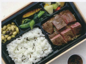
和牛ステーキ BENTÔ 福井“いちほまれ”とワイルドライス 4,000円 (税込)

〔アレルギー表示指定原材料〕小麦、乳成分、卵、牛肉、 豚肉、大豆、キウイフルーツ、オレンジ