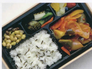
旬野菜のラタトゥイユ BENTÔ 福井“いちほまれ”とワイルドライス 3,000円 (税込)

たっぷりの野菜とトマト2個分の栄養で煮込んだ ベジタリアンメニュー。トマトには幸せホルモン を生成するギャバが含まれています。