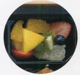
フルーツのデザート

緑黄色野菜のグリエと腸内環境を 整える食物繊維のバランスが良い 根菜を蜂蜜ビネガーでマリネに！