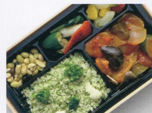
旬野菜のラタトゥイユ BENTÔ カリフラワー＆ブロッコリーライス 3,000円 (税込)

たっぷりの野菜とトマト2個分の栄養で煮込んだ ベジタリアンメニュー。トマトには幸せホルモン を生成するギャバが含まれています。