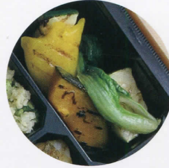
本日も入荷の色々野菜と根菜 のサラダ

ギャバやポリフェノールなどを含む 栄養価の高い発芽大豆をフレンチ ドレッシングでマリネに！