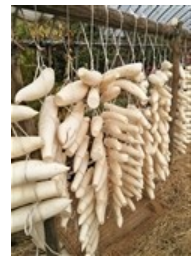
干し高倉ダイコン

【金額】 1セット 4,500円（税込・送料込） 冬の江戸東京野菜お楽しみレシピ付き