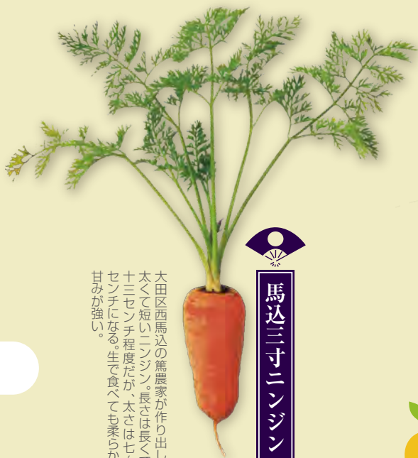
馬込三寸ニンジン

奥多摩地域では文化文政(一八〇四〜一八一九年ごろ)には盛んに栽培されていた。現在も溪流沿いにワサビ田が点在し、都内で収穫されるワサビのほとんどが奥多摩町産。