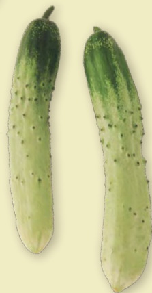
馬込半白キュウリ

大田区西馬込の篤農家が作り出した、大きく短いニンジン。長さは長くても十三センチ程度だが、太さは七〜九センチになる。生で食べても柔らかく、甘みが強い。