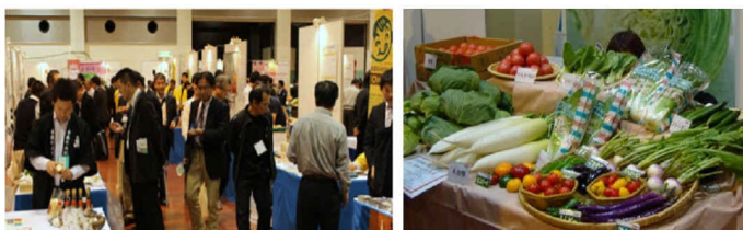
第19回仙台開催の様子

別紙の参加申込フォームに必要事項をご記入の上、Eメール又はFAXで事前に入場登録を していただくか、名刺2枚を当日ご用意していただき、ご来場ください。