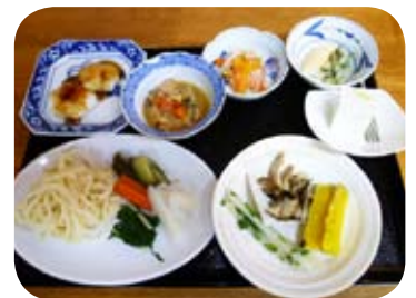
過去のカフェ料理より

光を当てずに育てた白くてやわらかい食感、いかにも早春らしい香りを漂わせる東京うど。今回も、前菜からデザートまで多彩にお楽しみいただきます。