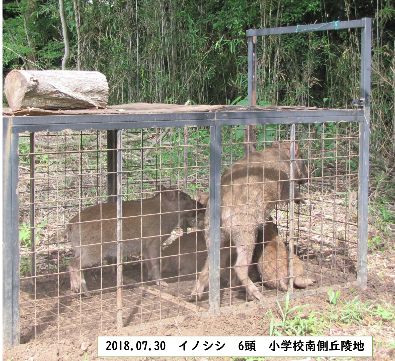
2018.07.30 イノシシ 6頭 小学校南側丘陵地