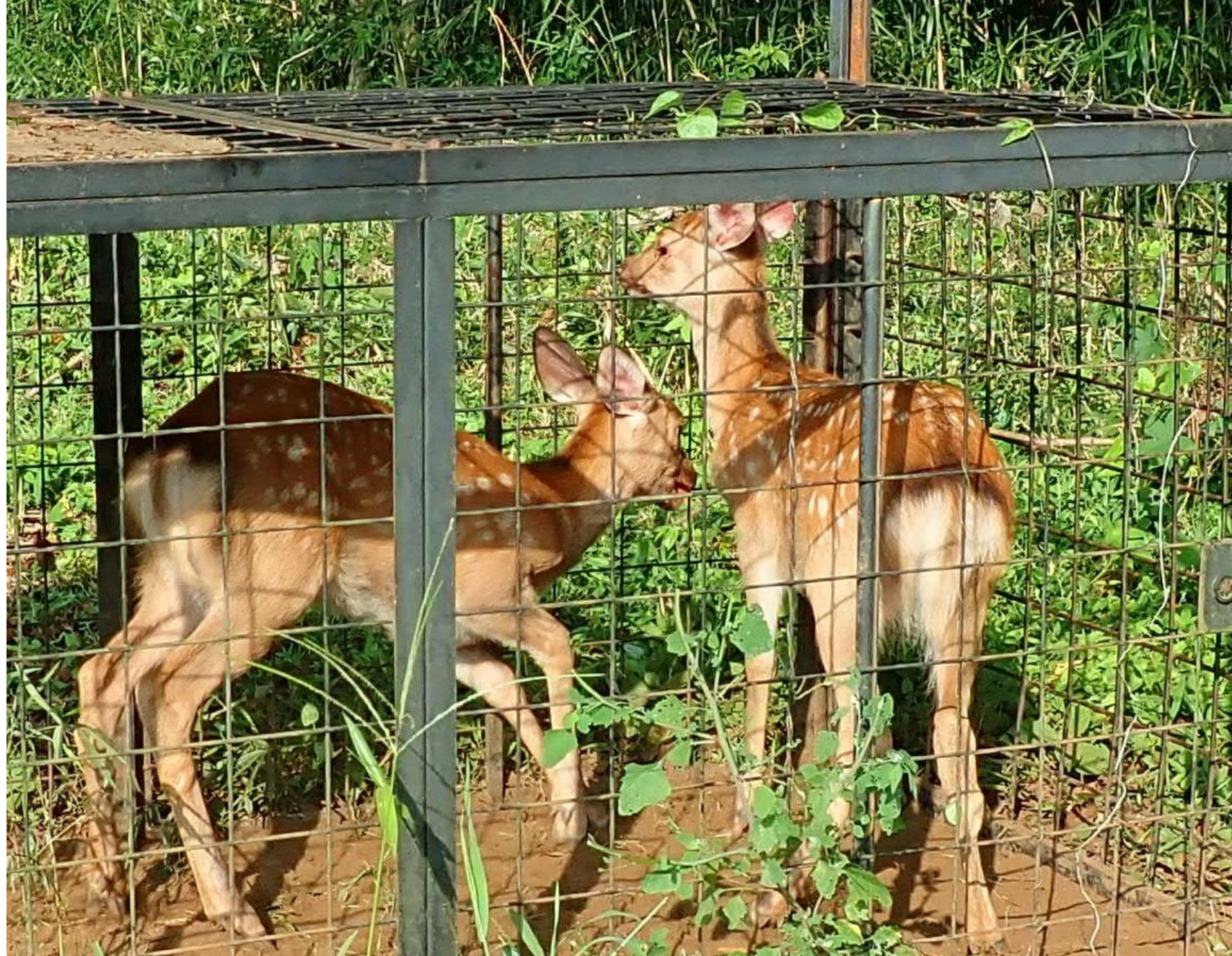
2020.08.28 ニホンジカ幼獣 小学校南側丘陵地