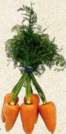
馬込三寸ニンジン

日本原産の伝統香辛料で、文政6年(1823)の『武蔵名勝図絵』の多摩・梅沢村の項に「山葵(わさび)この地の名産なり、多く作り手江戸神田へ出す」とある。