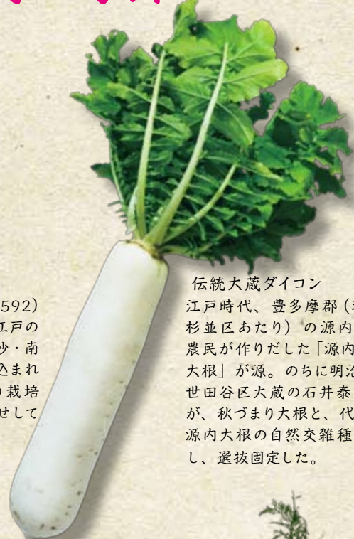
伝統大蔵ダイコン

天正年間(1573～1592)に摂津(大坂)から、江戸の砂村(現在の江東区北砂・南砂)や品川などに持ち込まれた葱。関東では葉葱の栽培が難しく、根本を土寄せて白葱が生まれたという。