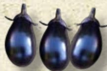
寺島ナス(蔓細千成ナス)

内藤家の菊座南瓜(きくざがぼちや)は新宿で名をはせ、周辺の角筈村や柏木村でも栽培されるようになり、地場野菜として定着していった。