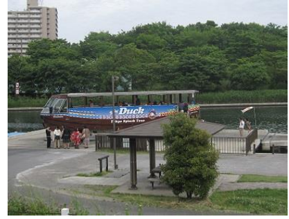
中川船番所・川の駅