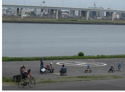
荒川で子供自転車教室