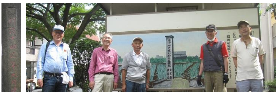
昭和30年代に広がっていた「東京都特産砂村葱採種場」看板