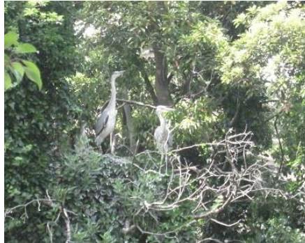
野鳥島のアオサギの幼鳥