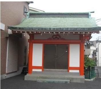
明治14年建立の妙法陶首稻荷神社