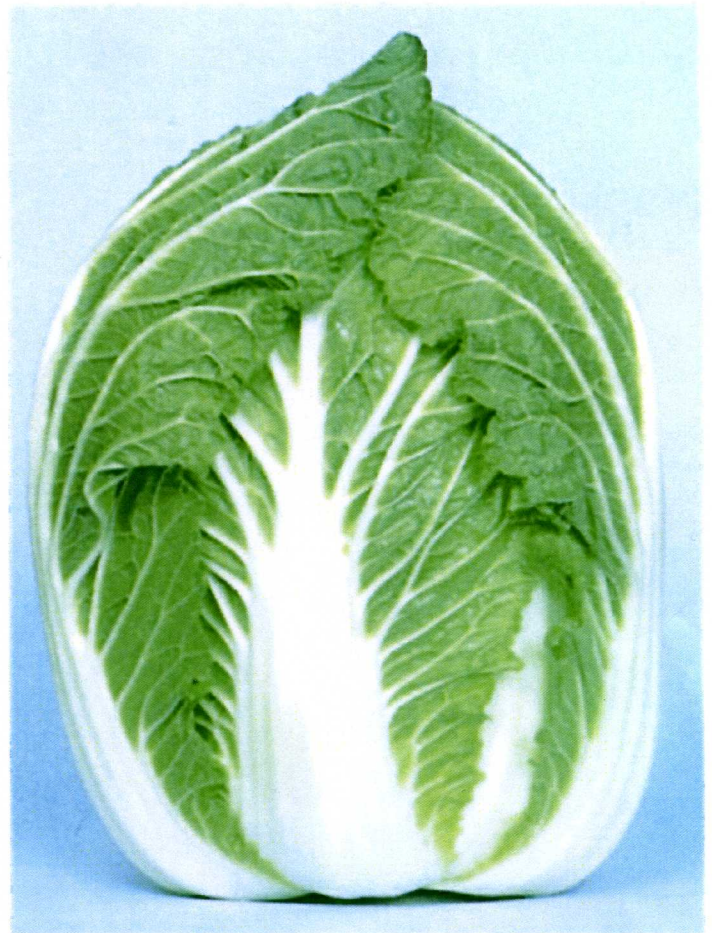
白菜品種「オリンピア」（渡辺採種場育成品種 / 1964）

二つのフィールドを行き来しながらの「食の学び」－ 土を耕す人たち、スポーツをプレーする人たち、食を 愛する人たち、アスリートに声援を送る人たち・・・ 二つのフィールドには、たくさんの人たちが集います。 ふるさとの畑のフィールドから生まれる作物には、 ふるさとを愛するたくさんの人たちの思いや願いが込 められています。また、それを食す人たちのそれぞれの フィールドでは、その思いや願いがたくさんの人た ちの大きな「チカラ」につながっているのです。 ふるさとの畑のフィールドで、仙台白菜「オリンピ ア」を育ててみよう！私たちは、様々なフィールドで の「食の学び」を通して食の本質や食の新たな可能性 と出会うのです。