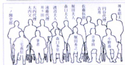
河北文化賞受賞者一同 東京オリンピックで活 躍した東北のメダリス ト達も勢揃い