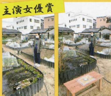
チームコバ元気な子供たち さん