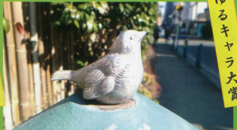
カラコネオフィス ポークロイドさん