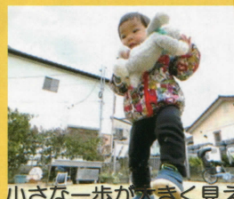
小さな一歩が大きく見える オオクラ・ズボラ・ファームさん