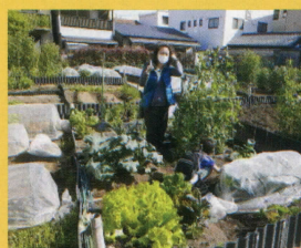
チームコバ元気な子供たち さん