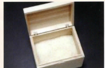
「桐箱・木製蝶番」 飯塚得生