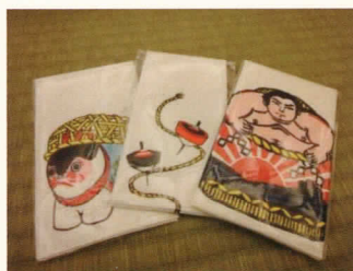
「木版画」摺師 剣持和也 【実演致します。】