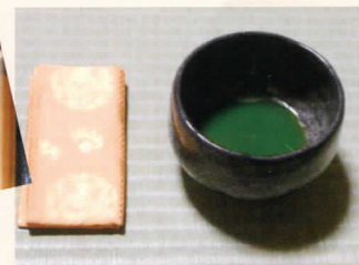
「茶の湯の心」 お薄を一服どうぞ・・・。