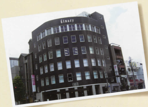
西日本支社 京都府京都市 烏丸七条ビル