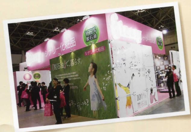
エコプロダクツに出展 東京ビッグサイト