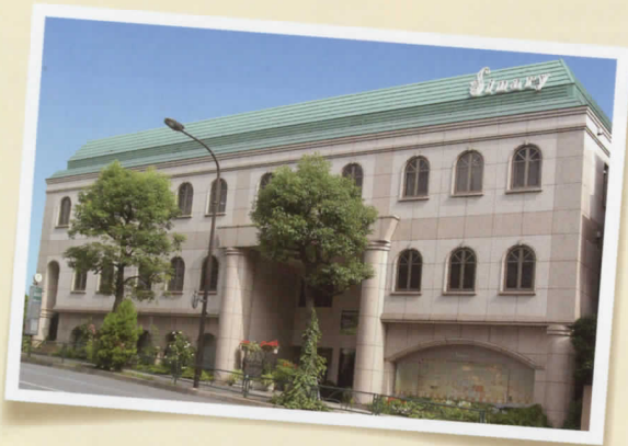
本社 東京都品川区上大崎

シナリーは創業以来、『環境革命』のもとに天然成分による化粧品、日用品、フレグランスなどの製品づくりを実現し、環境と子供たちの未来を守るための『脱石油ライフ』を提唱しています。