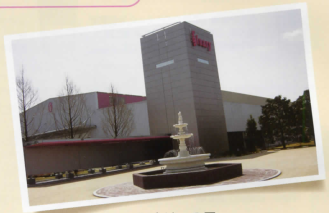
シナリーの里 千葉県東金市