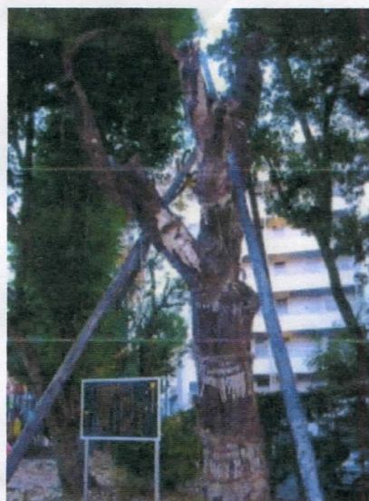
* 指定解除直前の禪寺丸柿