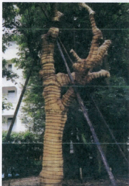
* 平成 15 年・移植時（落合公園）