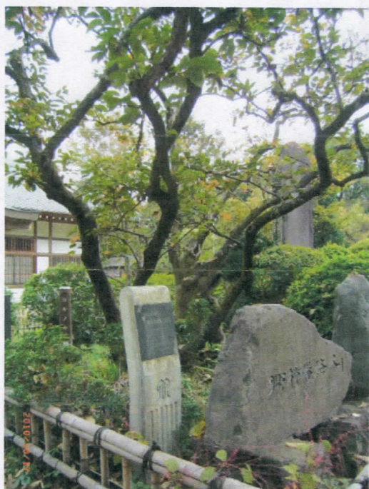
* 柿生王禅寺禅寺丸柿（原木）