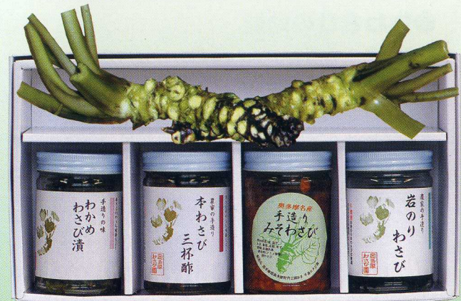
⑫詰め合せセット(生わさび2本付き)