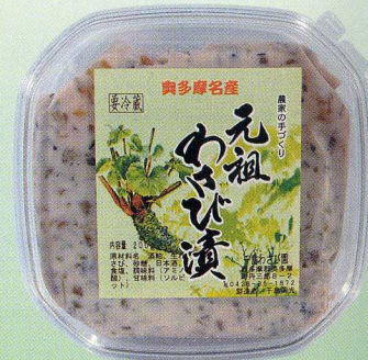
⑨元祖わさび漬(角パック)