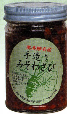
①手造りみそわさび

茎を使ったわさび漬は奥多摩名物です。1本ずつ皮をむき、腋芽(根茎の表面にあるぶつぶつ)をこそぎ、茎と根茎に分けて選別します。大きいものは市場へ、小さいものは茎とともにわさび漬にします。細かく切った茎は味付けした酒粕に混ぜて漬けます。千島のわさび漬はすべて手造りです。