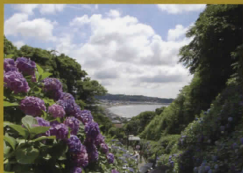
成就院から望む由比ヶ浜