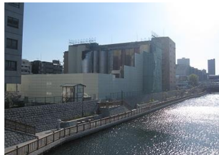
小名木川東京製粉工場撤去作業