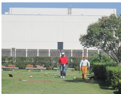
江東区営新砂運動場