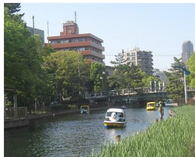
横十間川親水公園