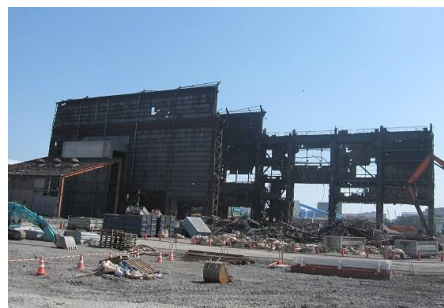
大三製鋼工場撤去作業