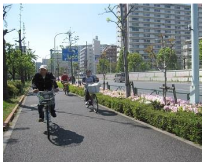
永代橋通り南砂駅前