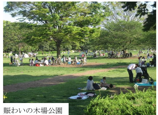
賑わいの木場公園