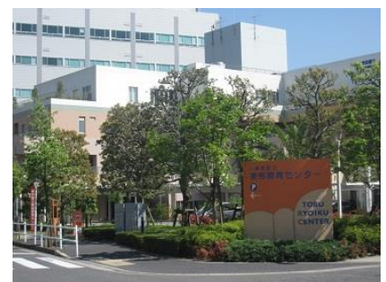
東京都東部寮育センター