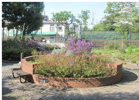
仙台堀川公園ハーブ園