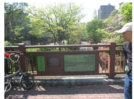
仙台堀川弾正橋碑