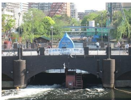
江東区マイクロ水力発電