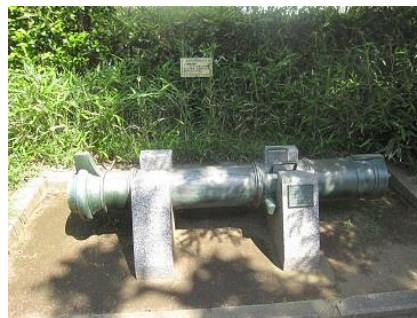
長州藩大砲鋳造場跡