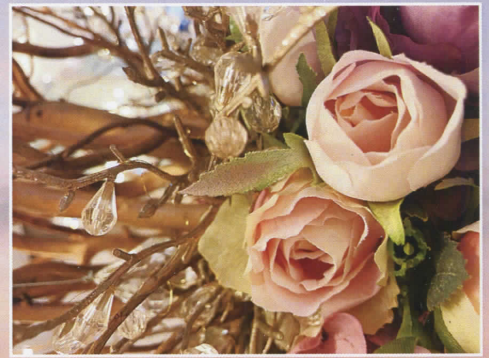
題字/箱山直樹 会員