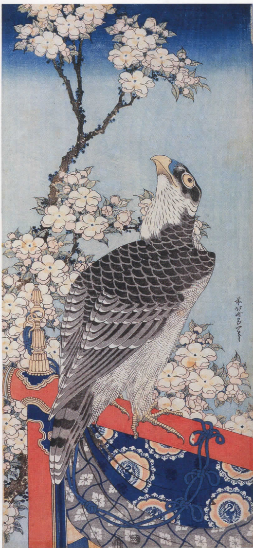
「桜に鷹」 Falcon and Cherry Blossoms