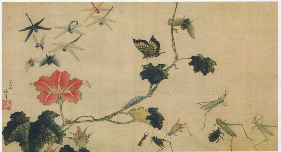
「南瓜花群虫図」 Pumpkin Blossoms and Swarm of Insects

動物 物は絵画の不朽のモチーフであり、北斎も多くの作品を残しています。その表現方法も、描かれる対象の性格を捉え、癒されるようなかわいらしい表現から、写実的な画法による思いもよらない個性的な表現まで多岐に渡ります。北斎の動物には、繊細な表情を伝えるような特徴的な目で描かれたものもあります。 本展では、北斎とその門人の描いた動物や、玩具や道具としてデザイン化された動物、物語や伝記などの文脈と共に描かれた動物や、空想の生き物など、絵画の中のさまざまな動物を紹介します。