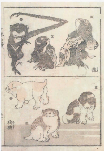
「三体画譜」 An Album of Painting in Three Styles